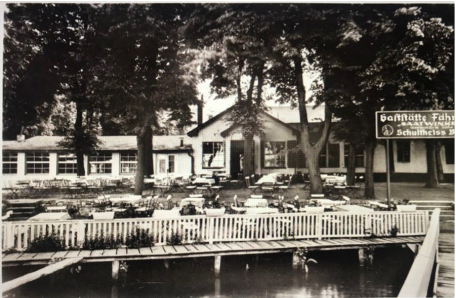
Gaststätte „Fährhaus Saatwinkel“ am Tegeler See